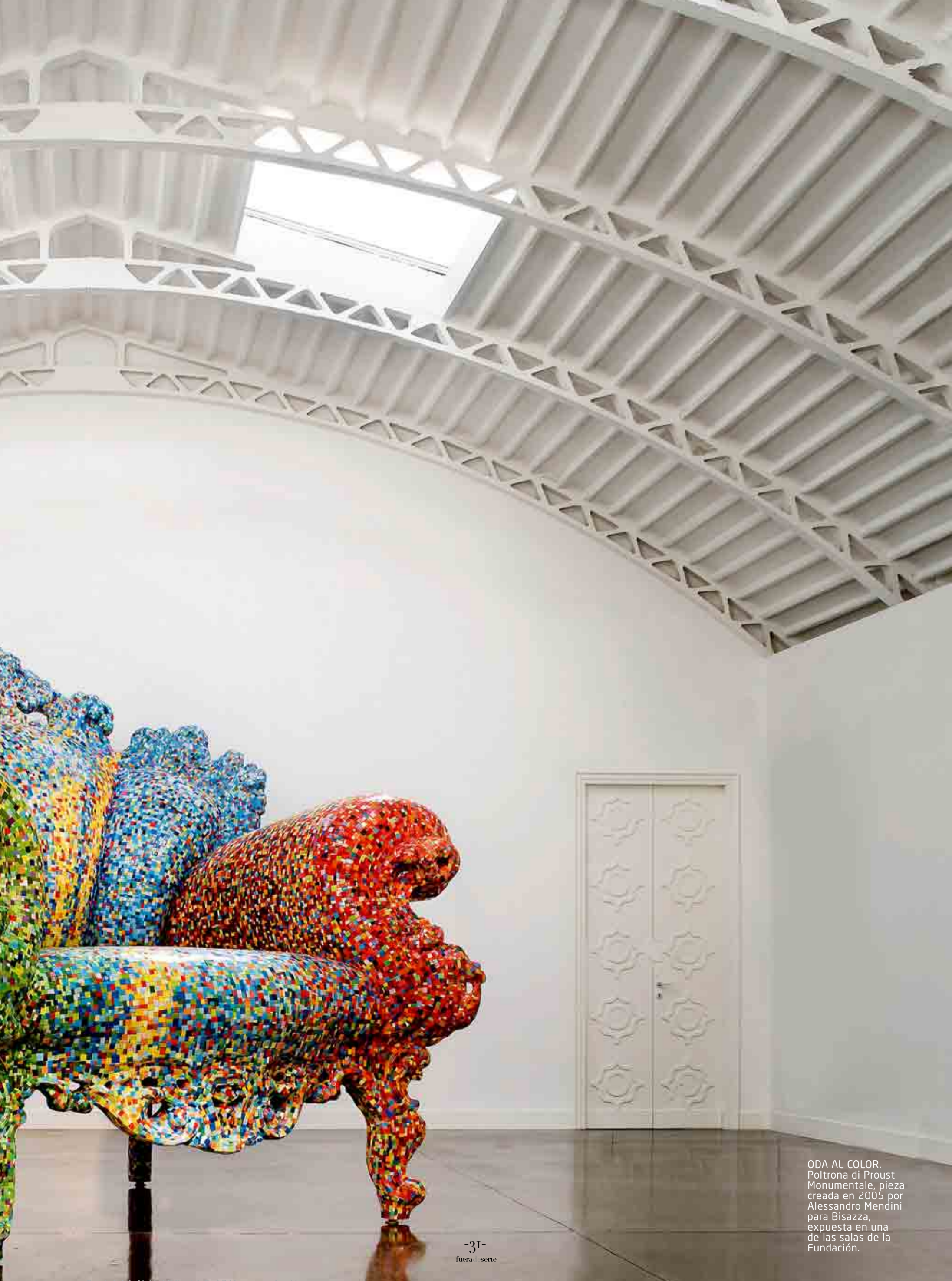
ODA AL COLOR. Poltrona di Proust Monumentale, pieza creada en 2005 por Alessandro Mendini para Bisazza, expuesta en una de las salas de la Fundación.