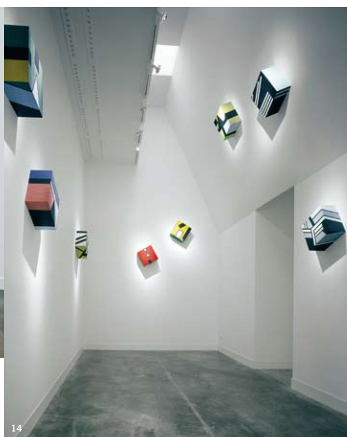
11. Obras de Pawson presentes en la exposición John Pawson-Plain Space . 12. Proyecto de Fabio Novembre. 13. La