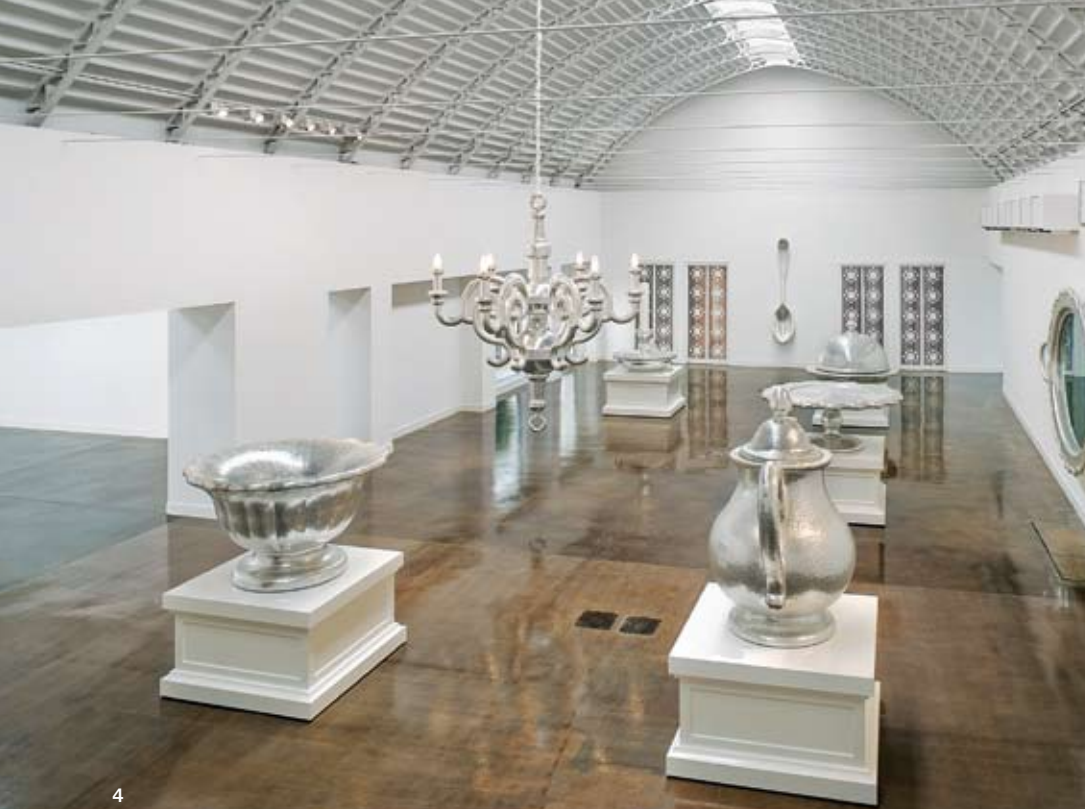
4. Silver Ware , de Studio Job, ocupa una de las naves. 5 y 10. En la galería del patio interior, los Mobili da Uomo de Mendini. 6. Instalación