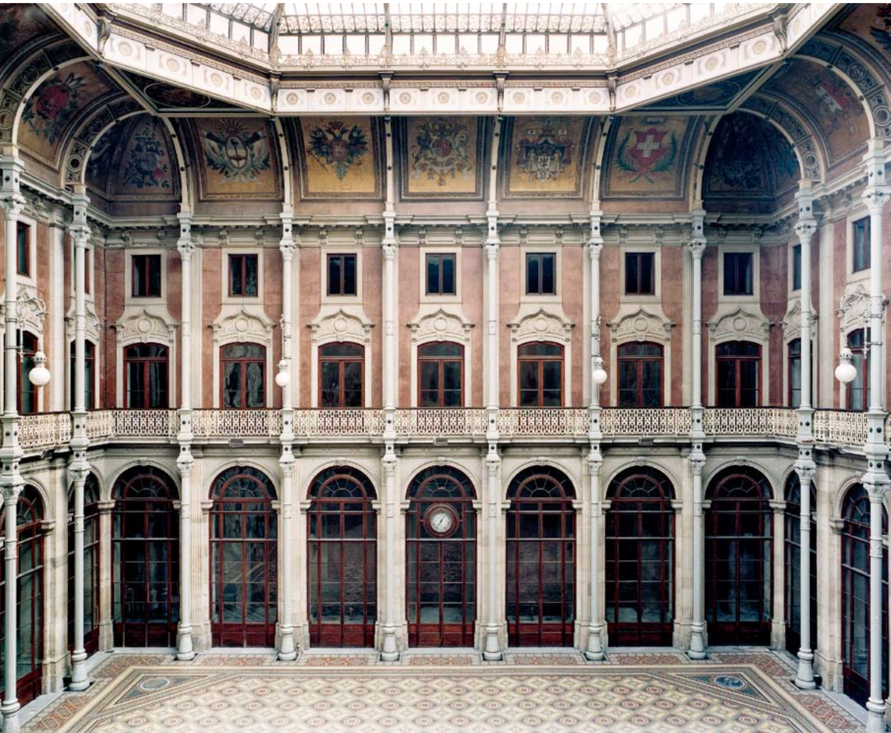
Fondazione Bisazza, Palacio da Bolsa no Porto II 2006.